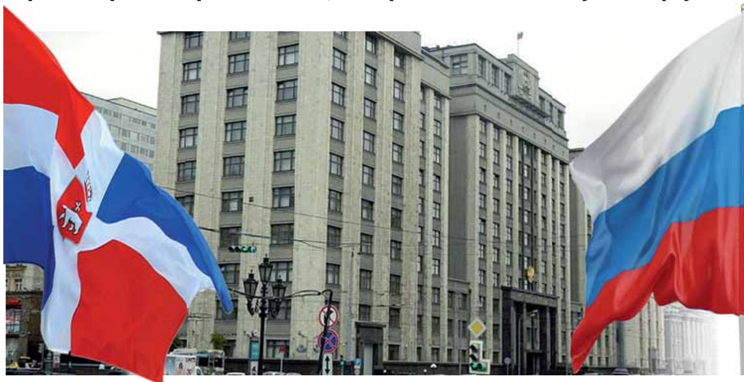
В Госдуму выборы вновь пройдут и по одномандатным округам

Пермь и Пермский край медленно, но верно начинают большую выборную кампанию-2016.