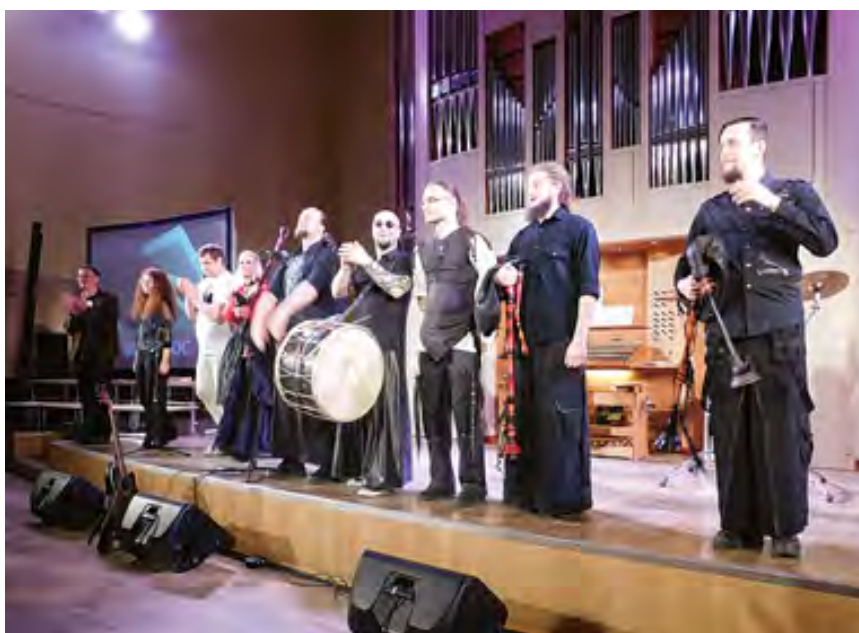
На сцене московская группа Teufelstanz