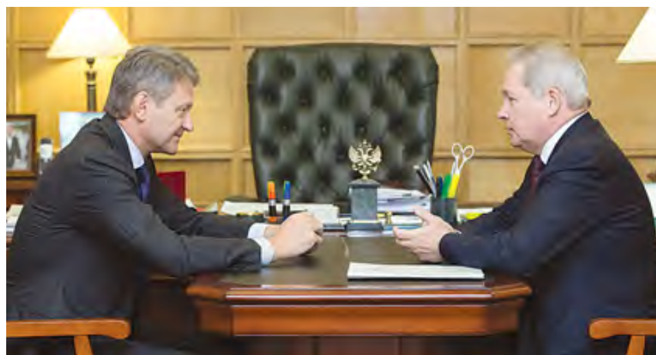
В рамках встречи говорилось об увеличении финансирования молочного и мясного животноводства

– Губернатор также задал вопрос, посвященный теме устойчивого развития сельских территорий. Мы просили по возможности