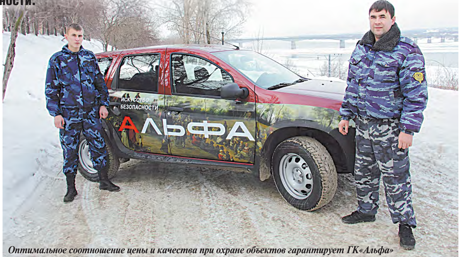
Оптимальное соотношение цены и качества при охране объектов гарантирует ГК «Альфа»

— Сделаем нехитрый арифметический подсчет. Минимум 4 раза ежедневно предприятие обязано объезжать объект, осматривать его, вести журналы и так далее. Возьмем, к примеру, самый простой советский автомобиль «лада девятка» с расходом бензина, допустим, 7 литров на 100 км. Охранник проезжает какое-то расстояние от базы до объекта, осматривает объект и возвращается. Но это не простой человек, а квалифицированный охранник, прошедший соответствующую подготовку. Потом он приезжает еще раз, и еще... Умножаем стоимость даже самого дешевого бензина на количество дней в году, потом умножаем на 4 выезда. И что получаем? А получаем, что той, десятипроцентной, суммы не хватает даже на бензин. А ведь необходимо еще