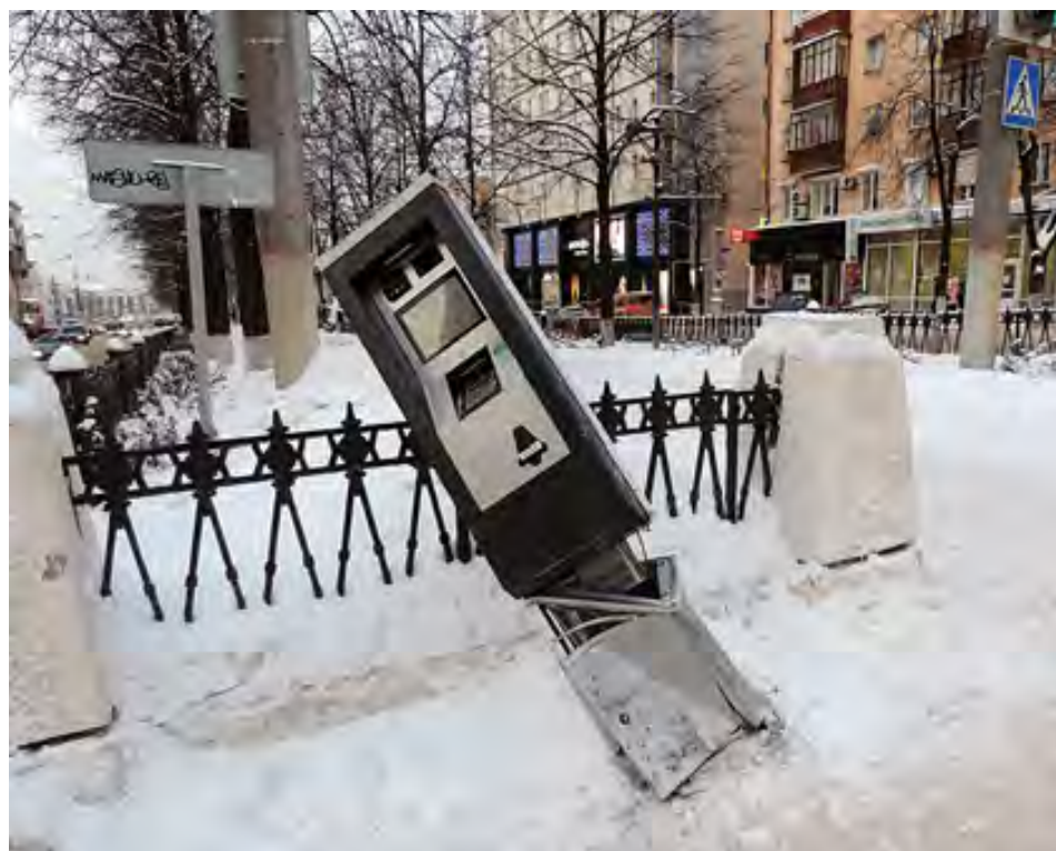
1 декабря на перекрестке ул. Пушкина и Комсомольского проспекта был совершен наезд на паркомат

На начало декабря мобильное приложение для оплаты парковки пермяки скачали порядка 90 тыс. раз. Об этом говорят данные статистики производителей мобильных телефонов. Но средняя оценка, которую ставят приложению пользователи, — две «звездочки» из пяти.