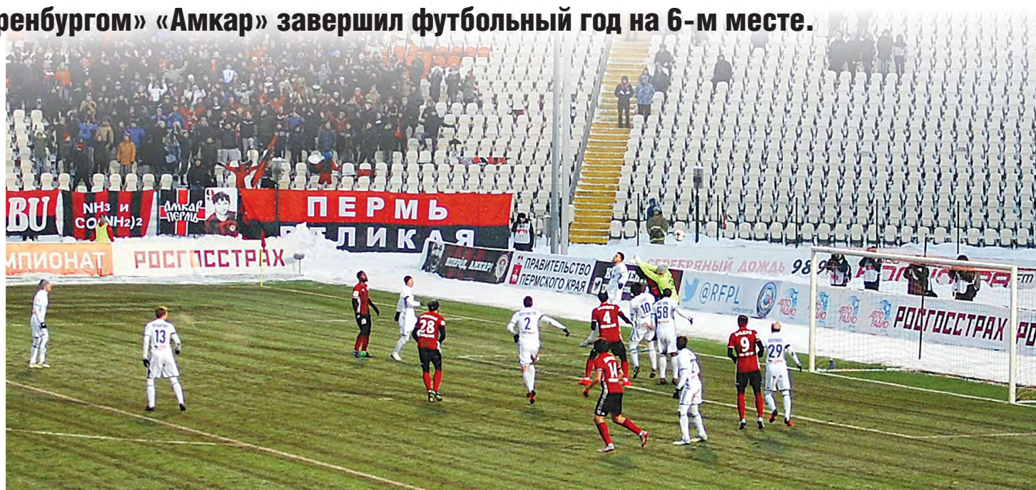
Болельщики надеются, что победный ход «Амкара» продолжится и во второй половине чемпионата

Подготовка к весенней части сезона начнется 12 января. Будет три сбора. Все сборы пройдут в Турции — соотношение расходов и качества там наилучшее, — отметил наставник «Амкара».