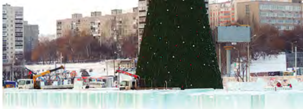
В ледовом городке уже установили елку

«Подрядная организация изготавливает лед методом нарезки ледовых блоков из Мулянки. В настоящий момент лед завезен в полном объеме», — сообщили в департаменте культуры и молодежной политики администрации Перми.