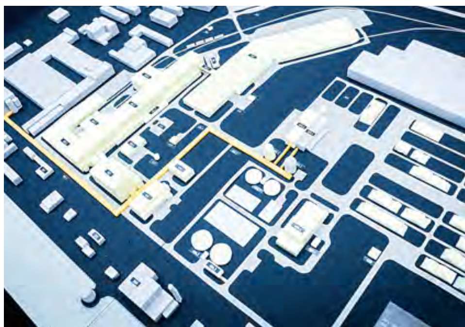
Новое производство подразумевает создание на ЦБК 300 рабочих мест