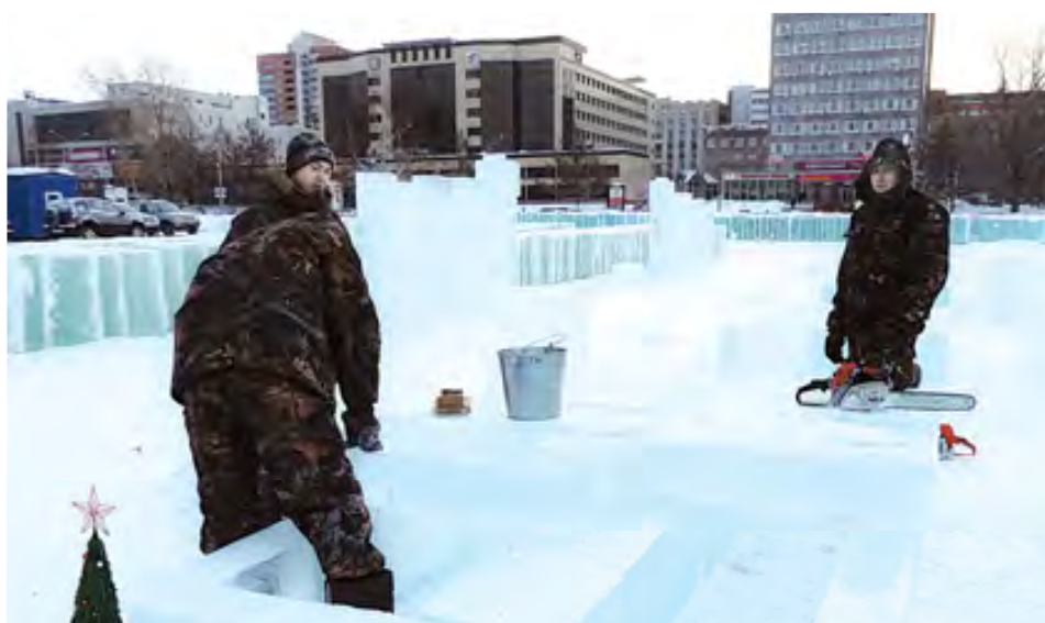
С помощью пил ледяным блокам придают нужную форму

Рабочие с помощью пил придают ледяным плитам форму, шлифуют поверхность, потом монтируют — делают подиум для снежных и ледовых фигур. В январе скульпторы из 14 стран порадуют пермяков своим творчеством в рамках V Кубка России «Зимний вернисаж».