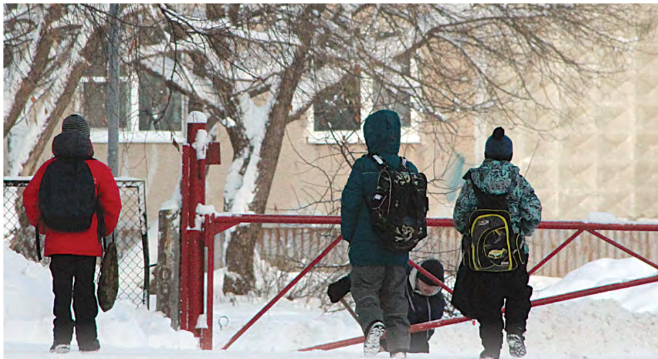
Даже заниженные в 2 и 3 раза местные нормативы обеспеченности школами и детсадами не выполнялись!

Вот как объяснял г-н Ложкин в Wordpress, почему Перми хватит 35 детсадовских мест на 1 тысячу человек: «В начале 2012 года город Пермь находился на гребне демографической волны, связанной