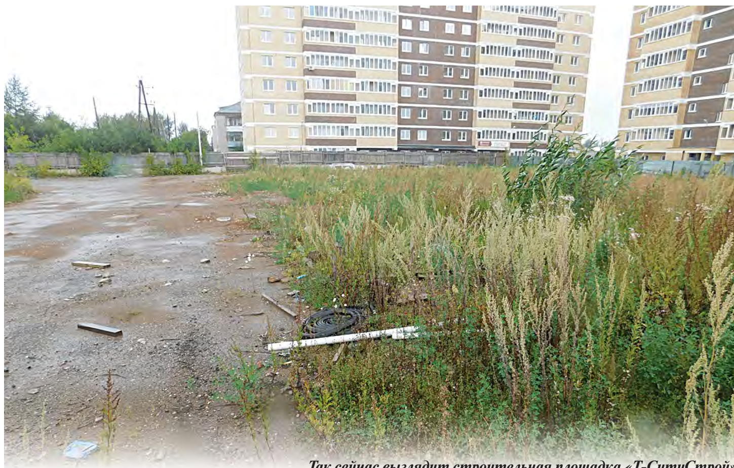
Так сейчас выглядит строительная площадка «Т-СитиСтрой»

думы занимаются вопросами обманутых дольщиков, мы пришли к выводу, что ЖСК — единственная легитимная конструкция, которая позволяет гражданам организоваться и не упустить объект, чтобы он в дальнейшем в процедуре банкротства не реализовывался с молотка, и пайщики не получили потом «по копейке». Почему люди против — тоже объяснимо: они уже запла-